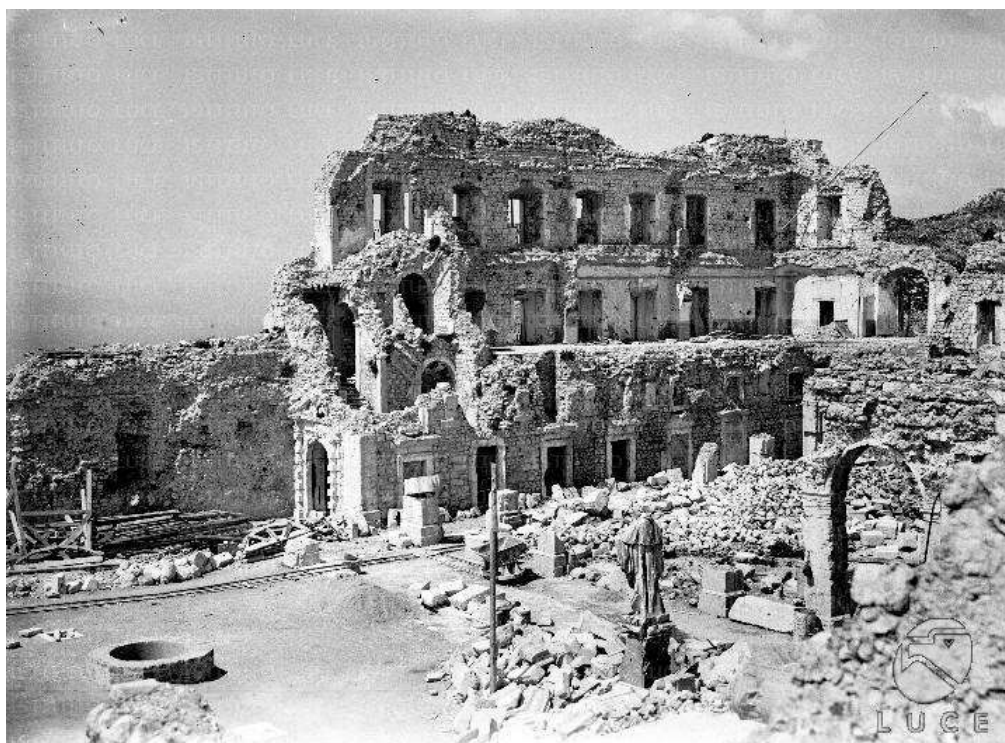
FIG. 4 – Ripresa dell'interno dell'Abbazia di Montecassino, in cui sono cominciati i lavori di ricostruzione, 1947.

Con la legge del 7 luglio 1866 n. 3036 per la soppressione delle Corporazioni religiose, l'Abbazia di Montecassino venne dichiarata monumento nazionale. Il monastero diventò sede della diocesi cassinese, di cui l'abate è l'ordinario, e residenza del capitolo dei monaci. La gestione del suo straordinario patrimonio venne posta sotto il controllo del governo italiano.