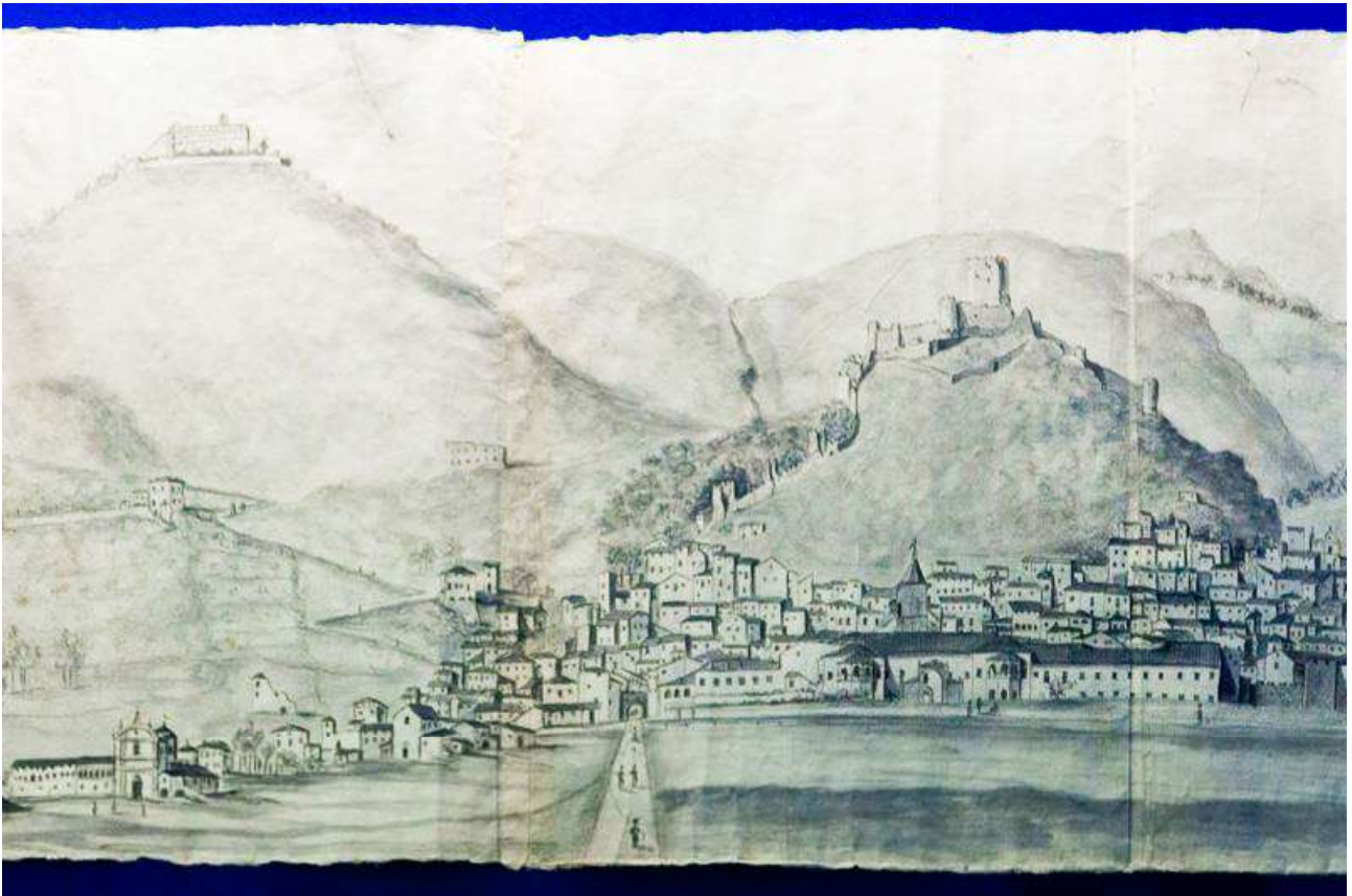
FIG. 2 – Disegno raffigurante la veduta di Montecassino e di San Germano, risalente al XVII secolo.

Nel 577 l'Abbazia di Montecassino cominciò a subire le prime invasioni distruttive come quella da parte dei Longobardi. I monaci non poterono far altro che abbandonare l'abbazia e cercare rifugio presso la città di Roma portando con loro le spoglie di San Benedetto. Dal 643 i monaci trovarono ospitalità nella comunità di San Colombano a Bobbio e in seguito nei vari monasteri ed abbazie colombiane in Italia ed in Europa, avendo così la possibilità di diffondere il messaggio del santo di Norcia e di conseguenza accrescere di molto le comunità benedettine. Ricostruita intorno al 718, venne distrutta una seconda volta dai Saraceni nell' 883, venendo riedificata per volere di papa Agapito II solo nel 949. La comunità monastica, tuttavia, riuscì sempre a risollevarsi, e l'abbazia divenne un importante centro di trascrizione e conservazione dei testi antichi.