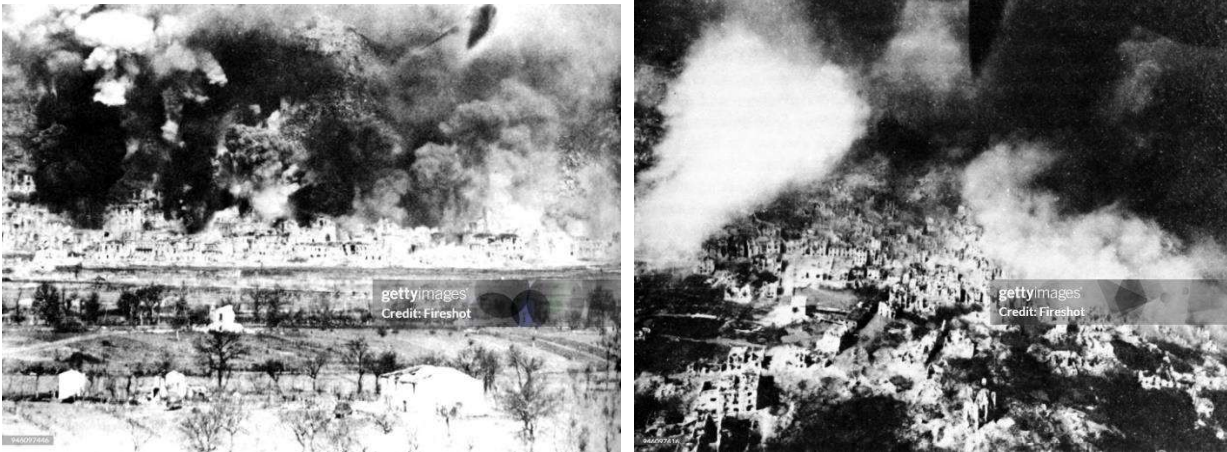
FIG. 5: Bombardamento di Monte Cassino nel febbraio del 1944.

Uno degli episodi più tragici nella storia dell'abbazia avvenne durante la Seconda Guerra Mondiale. Nel 1944, un potente attacco delle forze alleate rase al suolo l'intera Abbazia, credendo che lì ci fossero nascoste le truppe tedesche. Quasi nulla rimase intatto da quel bombardamento.