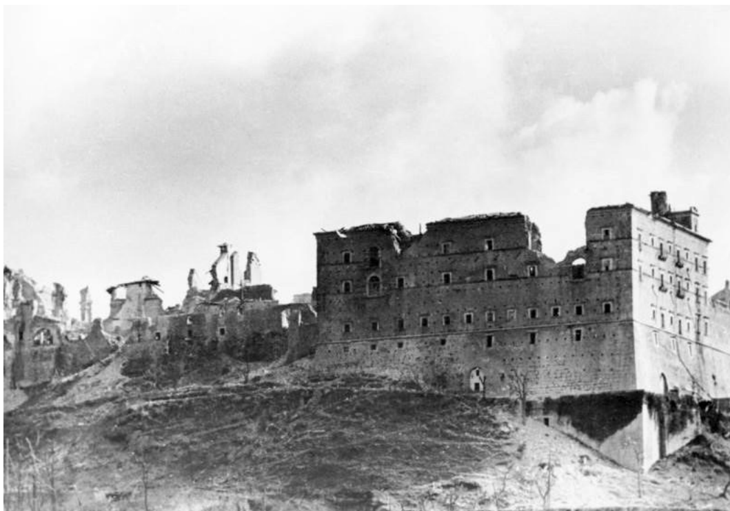
FIG. 3 – L'Abbazia di Montecassino dopo i bombardamenti del febbraio 1944. Immagine tratta dal web.

Distrutta da un terremoto nel 1349 e nuovamente ricostruita nel 1366, l'abbazia assunse nel XVII secolo l'aspetto tipico di un monumento barocco napoletano, grazie anche alle decorazioni pittoriche di numerosi artisti.